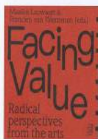
Cover Facing Value