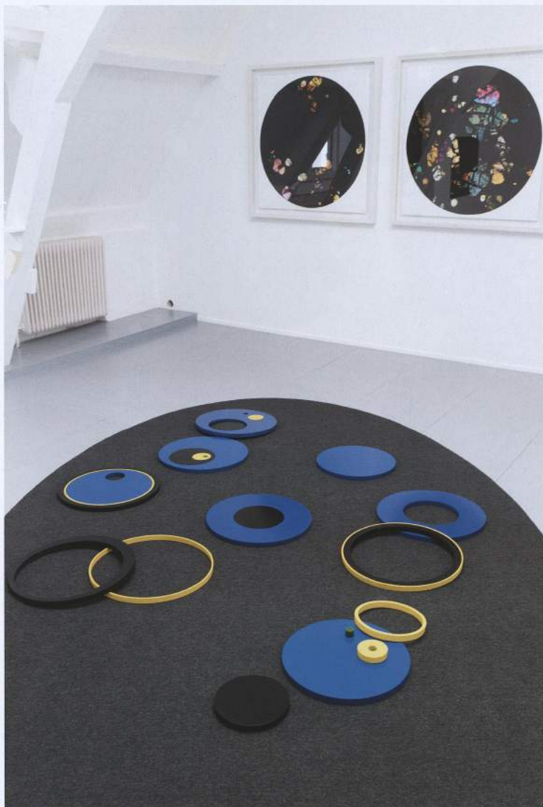
Marjolijn Dijkman, Composition of the Universe , 2011, geschilte op papier; Reto Pulfer, Wunderkammer , 2015, plasmendruk op papier van gerecycleerd karton, onderdeel van Casco Art Institute ; Working for the Commons bij Casco, 2017, foto Niels Molenaar

‘Slow down, think more and self-reflexively, and then think and act with a longer frame of time’