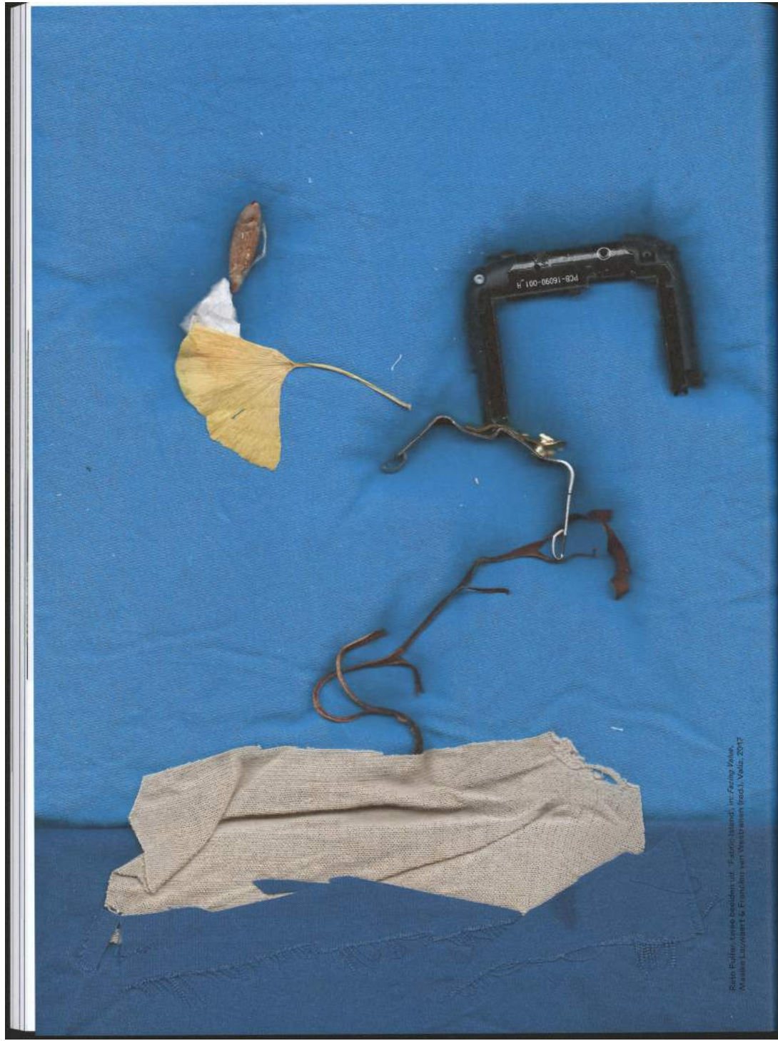
Seite 100 Foto: ... ... ...