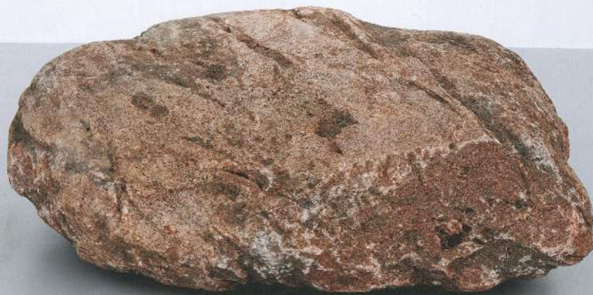
Alice Krawiec, Shelter Day , 2015, steen, motor, 60 x 100 x 115 cm, lijf van een mens, in omringelings-eenheden van een jaar, waarbij absolute stilstand wordt gesuggereerd.

Degrowth is tot nog toe meer een individuele, dan een institutionele ambitie