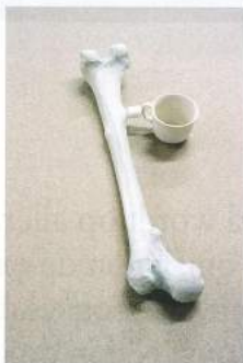
Mark Manders, A Place Where My Thoughts Are Frozen Together , 2001, geschilderd porselein, geschilderde epoxy en sulkerklontje, 44 x 16 x 6,5 cm, courtesy Zeno X Gallery, Antwerpen