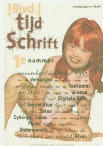
→ Tijdschrift Blvd, 1993.