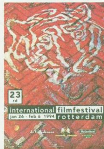
→ Affiche IFFR, 1994.