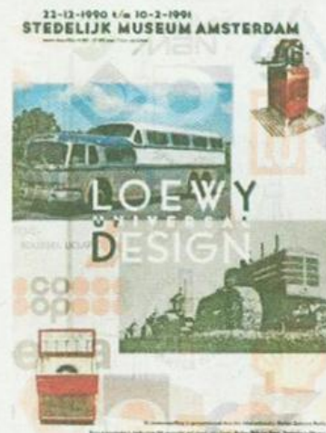
→ Stedelijk Museum, 1990.

De energie, humor en tegendraadsheid spatten van de 484 pagina's