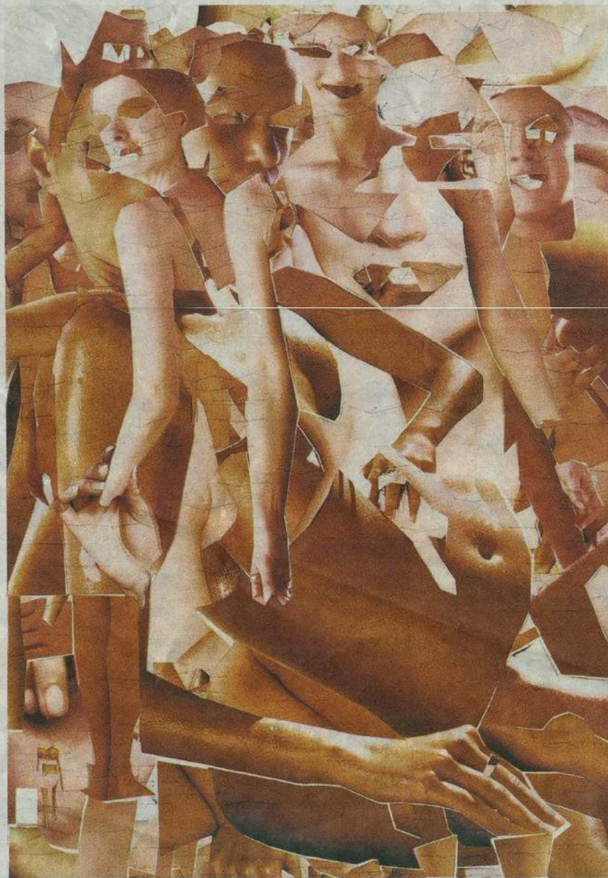
Een collage uit Poster N° 524 : "Door de geconcentreerde vorm zie je steeds dezelfde elementen terugkomen."

Alle affiches werden door Put en Petter 'gedeconstrueerd' op basis van zaken als compositie, taal en kleurgebruik. "We zijn gaan kijken hoe al die visuele boodschappen zijn vormgegeven; welke ontwerpkeuzes er zijn gemaakt. Hoe verschillend de boodschappen ook zijn, er zijn toch patronen en sjablonen waarneembaar. Omdat de affiches zijn gebaseerd op